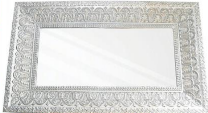
El gran formato y los marcos muy elaborados, se mantienen en la decoración actual, como esta propuesta de Ideas Marquetería.