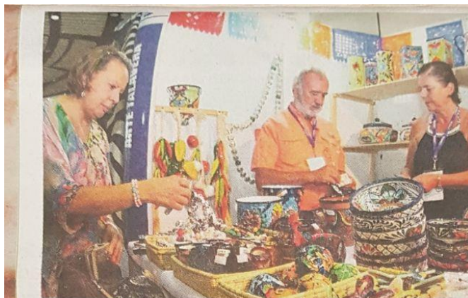
Artesanos de Colombia y otros países estarán presentes en Farex, en Cartagena.