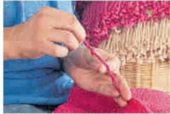
Los tejidos a mano son tendencia en este tipo de exposiciones.

Este evento se destaca por mostrar las expresiones culturales de diversas regiones de Colombia. Los indígenas, afros y artesanos tradicionales tienen un espacio protagónico en la exposición.