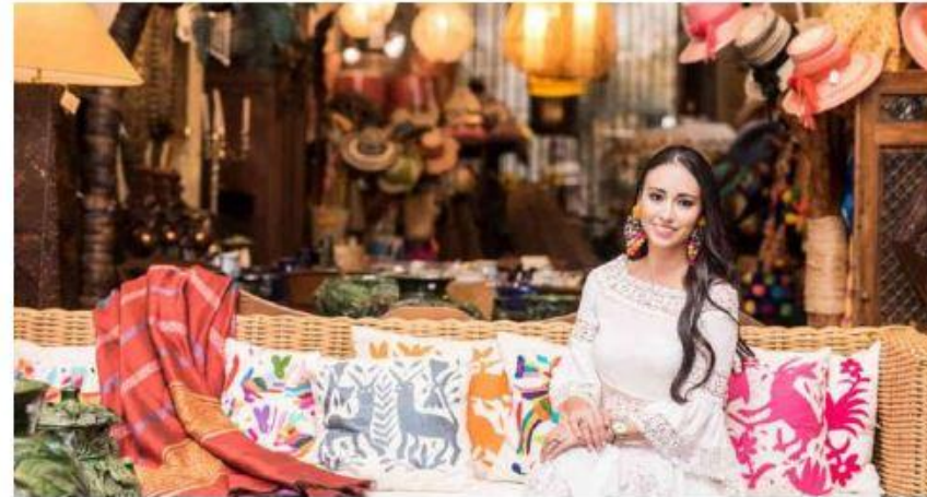
Una feria de exportación