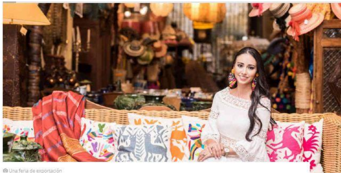
Una feria de exportación